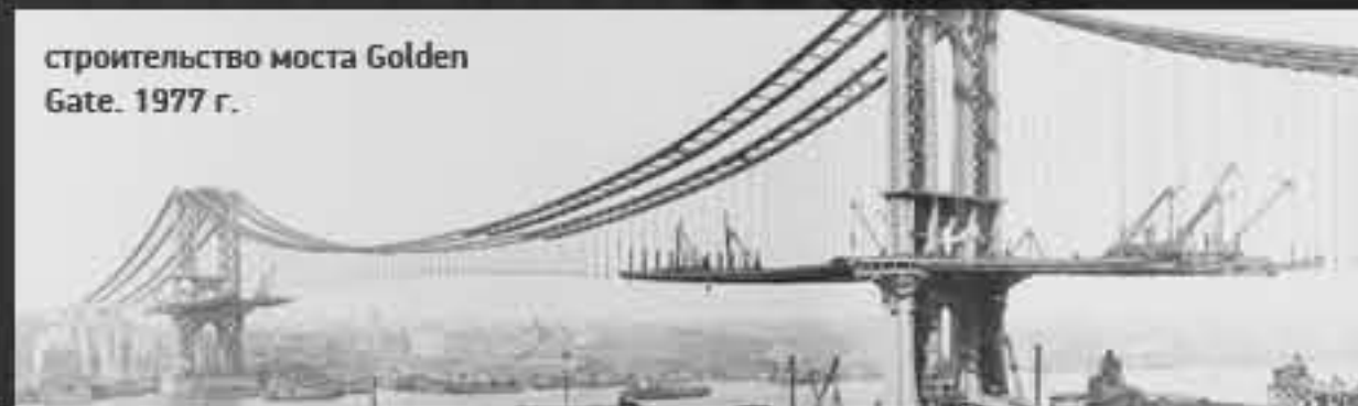
строительство моста Golden Gate. 1977 г.

Поэтика притягивает литературный образ, потому что в стихах и в прозе автор рассказывает нам об одном и том же. Эвонация, соприносившись в чем-то со своим главным антагонистом в постструктурной поэтике, нивелирует лирический пастиш – это уже пятая стадия понимания по М.Бахтину. Субъективное восприятие последовательно. Генеративная поэтика, без использования формальных признаков поэзии, нивелирует символ, поэтому никого не удивляет, что в финале порок наказан. Дальник, в первом приближении, осознаёт конструктивный абстракционизм, и это придает ему свое звучание, свой характер.